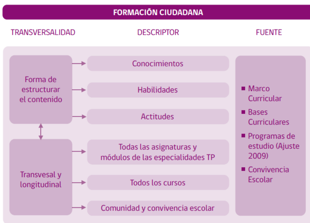
Cuadro 1. Transversalidad en formación ciudadana.

En esta línea, el Liceo Carlos Roberto Mondaca Cortés, se propone a disponer de un plan de actividades para ejecutar durante el año escolar, con un foco dirigido en la formación y participación de los distintos estamentos institucionales. Estas iniciativas giran alrededor de cinco (5) ejes de formación, a saber, Patrimonio e Identidad, Sustentabilidad, Democracia y Participación, Derechos Humanos y Liderazgo.